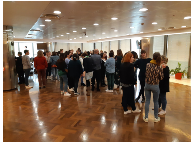
Constitution de 5 groupes de travail