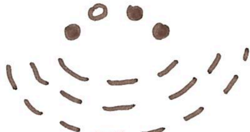
Table ronde "Tournante" avec invités et une chaise vide pour qui veut prendre la parole.